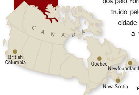
Arquitetura imponente e apresentações históricas revelam antigos hábitos dos moradores de Nova Scotia e British Columbia